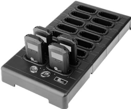
Docking Station 16 Auri-D16