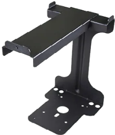
Intelligent Cable Management Unit LA-382