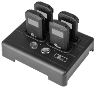
Docking Station 4 Auri-D4