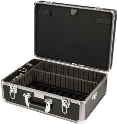
Docking Station Case 16 Auri-DC16